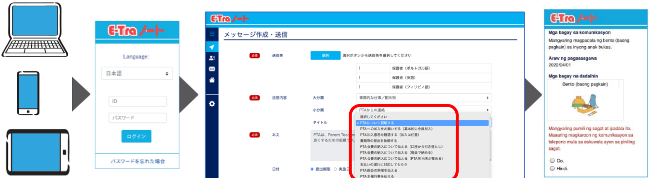
【E-Traノート for PTA】の追加機能